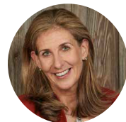
Indra Baier-Müller Landrätin des Landkreises Oberallgäu